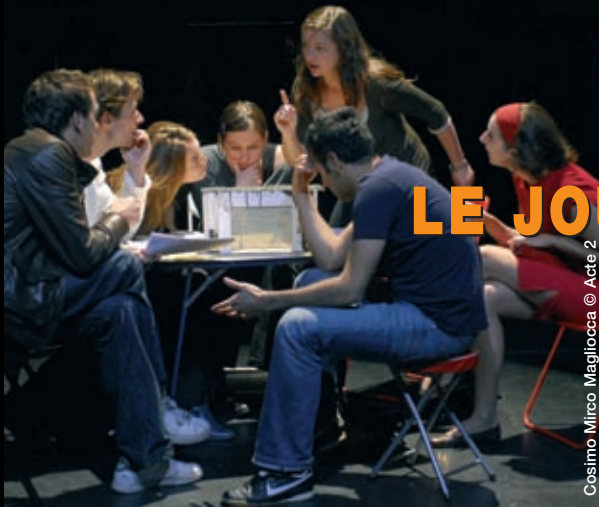
Cosimo Mirco Magliocca © Acte 2