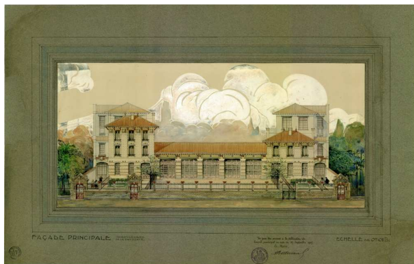
Façade principale du groupe scolaire, dessin de l'architecte Maurice Payret-Dortail (1907), Archives municipales de Neuilly-sur-Seine

En 1925, Maurice Payret-Dortail habite à Meudon. Il décède en 1929 d'une épidémie de fièvre typhoïde sans avoir vu l'achèvement de tous ses projets.