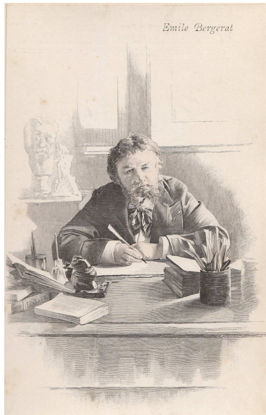
Gravure ancienne, Archives municipales de Neuilly-sur-Seine

La villa Emile Bergerat (ex-villa d'Orléans) est nommée ainsi par délibération du Conseil municipal en 1951 afin de rendre hommage à l'écrivain.