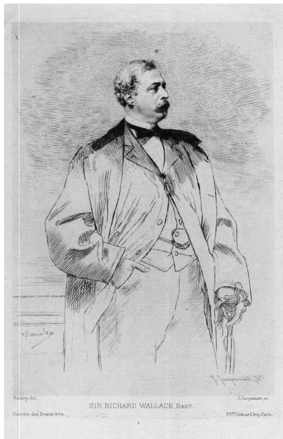
Portrait de Richard Wallace

Richard Wallace aide aussi financièrement les victimes des bombardements et subventionne de nombreuses ambulances militaires. Il participe à la construction du Hertford British Hospital (actuel hôpital franco-britannique) sur la commune de Levallois-Perret qui sera inauguré en 1879 par l'ambassadeur de Grande-Bretagne en France. En 1873, il est anobli en Angleterre et entre à la Chambre des Communes, la chambre basse du parlement anglais. Il vit à Neuilly jusqu'à sa mort à Bagatelle le 20 juillet 1890. Il repose au Cimetière du Père Lachaise à Paris. Il a légué sa collection d'œuvres d'art à l'Etat britannique et elle se trouve désormais dans un musée à Londres.