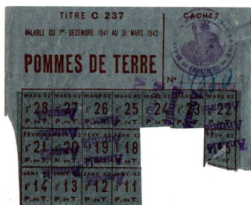
Tickets de rationnement (1942), Archives municipales de Neuilly-sur-Seine.

En 1942, plus de 500.000 cartes d'alimentation sont distribuées à Neuilly.