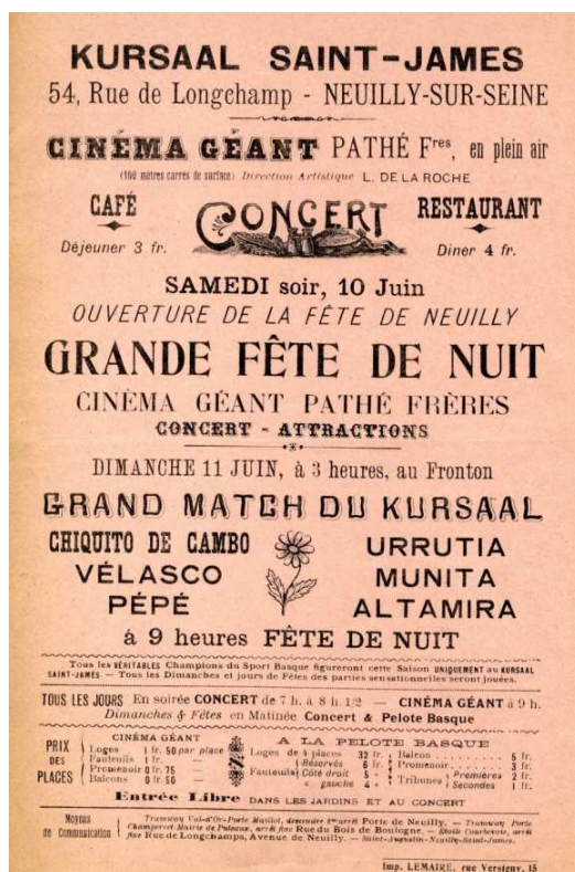
Affichette programme du Cercle Saint-James (sans date), Archives municipales de Neuilly-sur-Seine.

Outre un fronton de pelote basque, l'établissement compte aussi des cours de tennis, une salle d'escrime, des espaces de tir à la cible, un bassin de patinage, etc. Chaque jour, des animations sont proposées : concerts, cinéma en plein air, parties de pelote.