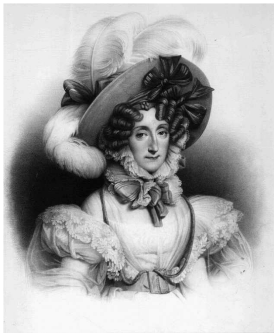
Marie-Amélie, Reine des Français, gravure ancienne

En janvier et février, le service des Archives municipales vous propose de découvrir les établissements de santé à Neuilly, de la maison de charité de la duchesse d'Orléans en 1828 à l'hôpital communal en 1935. (première partie)